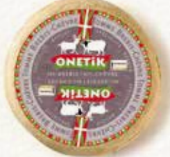
TOMME CHEBRIS CHÈVRE BREBIS