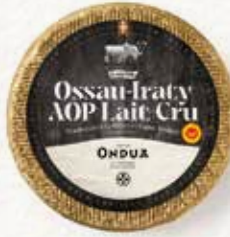
AOP OSSAU-IRATY LAIT CRU ONDUA