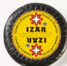
IGP TOMME DES PYRÉNÉES IZAR