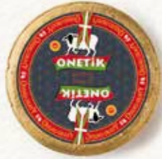
AOP OSSAU-IRATY AFFINÉ