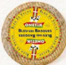
BLEU DES BASQUES AU LAIT DE VACHE