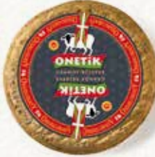
AOP OSSAU-IRATY GRANDE RÉSERVE