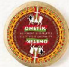
TOMME AU PIMENT D'ESPELETTE