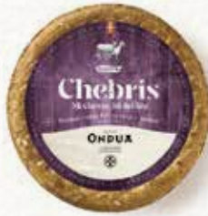
TOMME CHEBRIS ONDUA