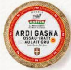
AOP OSSAU-IRATY LAIT CRU