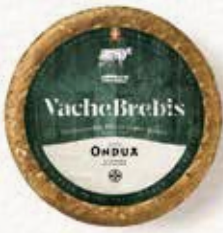
TOMME VACHE BREBIS ONDUA