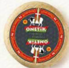
AOP OSSAU-IRATY PRIMEUR