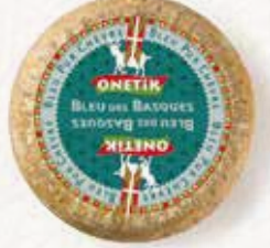
BLEU DES BASQUES AU LAIT DE CHÈVRE