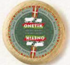
TOMME VACHE BREBIS