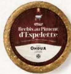
TOMME BREBIS AU PIMENT D'ESPELETTE ONDUA