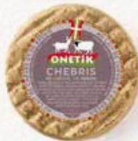
TOMMETTE CHEBRIS CHÈVRE BREBIS