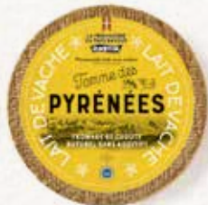
IGP TOMME DES PYRÉNÉES CROÛTE NATURELLE