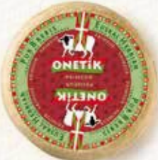
TOMME BREBIS PRIMEUR