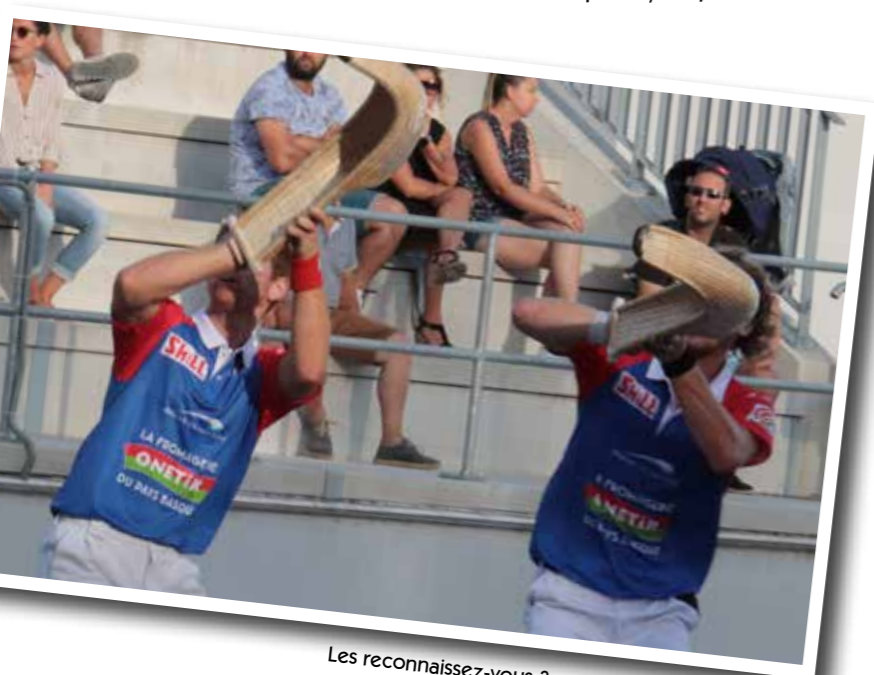
Les reconnaissez-vous ?