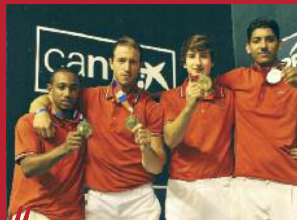
Paleta pelote de cuir : les médaillés d'or