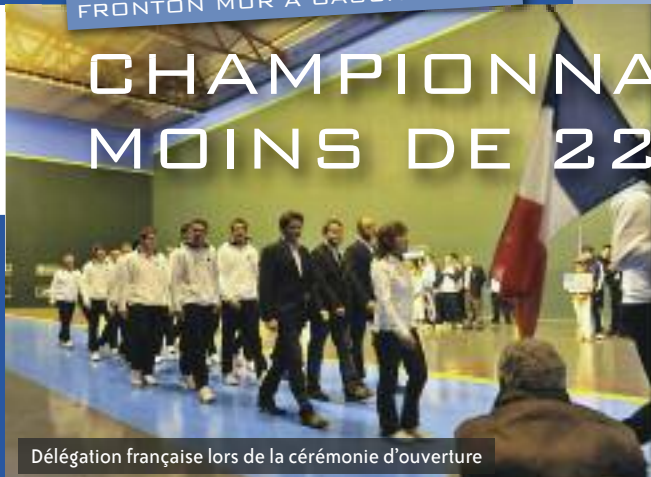
Délégation française lors de la cérémonie d'ouverture