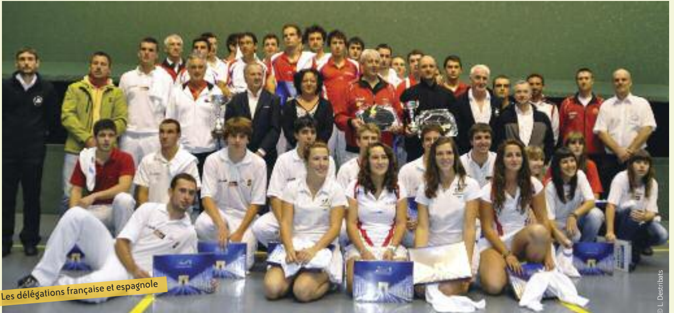
Les délégations française et espagnole