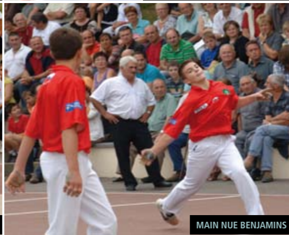
MAIN NUE BENJAMINS