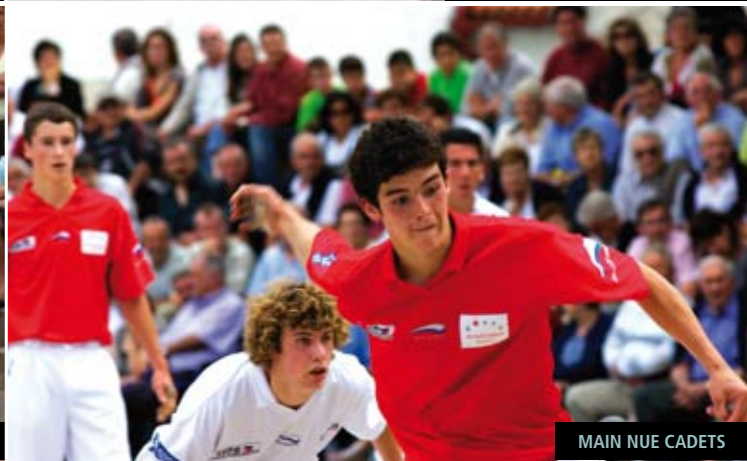
MAIN NUE CADETS