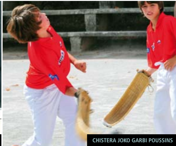
CHISTERA JOKO GARBI POUSSINS