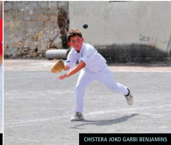
CHISTERA JOKO GARBI BENJAMINS