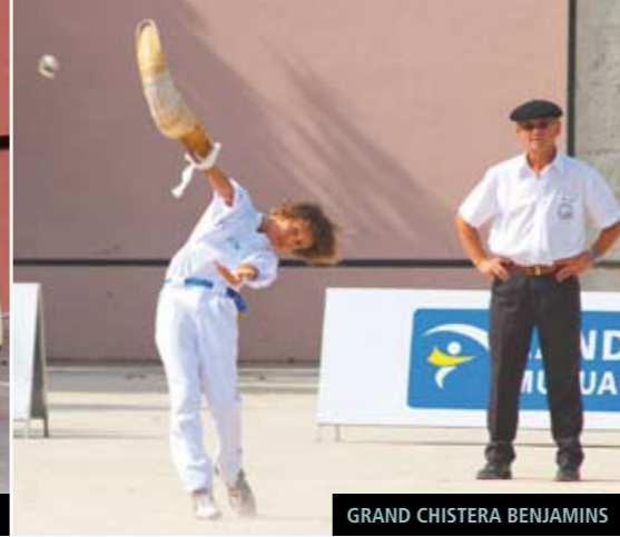
GRAND CHISTERA BENJAMINS