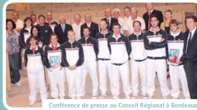
Conférence de presse au Conseil Régional à Bordeaux