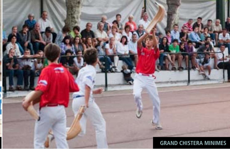
GRAND CHISTERA MINIMES