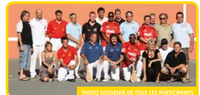
PHOTO SOUVENIR DE TOUS LES PARTICIPANTS