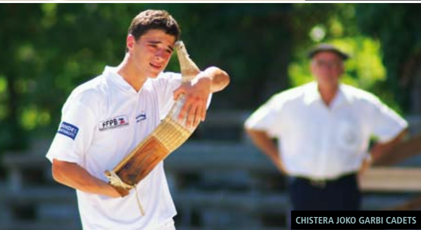
CHISTERA JOKO GARBI CADETS