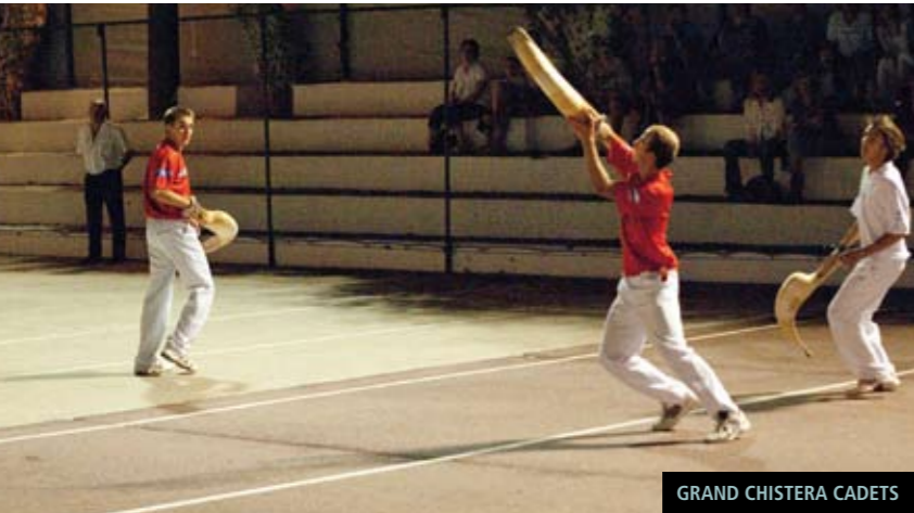
GRAND CHISTERA CADETS