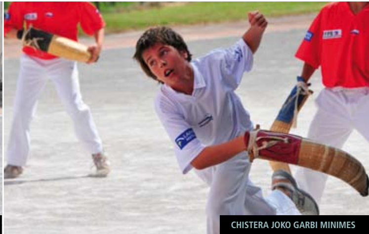
CHISTERA JOKO GARBI MINIMES