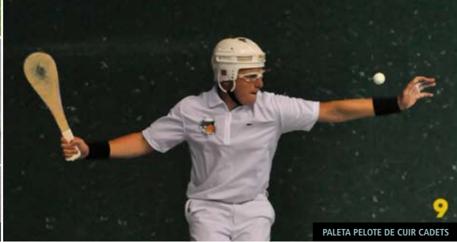
PALETA PELOTE DE CUIR CADETS