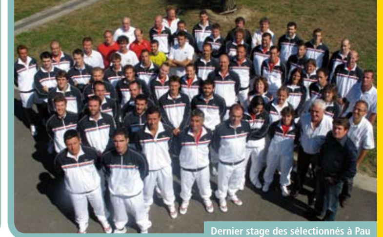
Dernier stage des sélectionnés à Pau