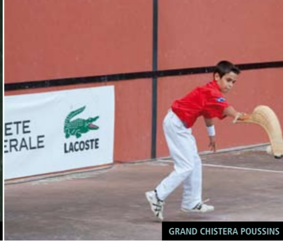
GRAND CHISTERA POUSSINS