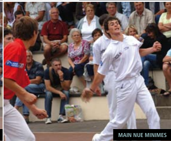
MAIN NUE MINIMES