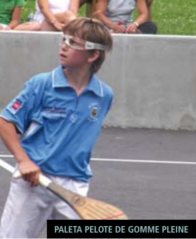
PALETA PELOTE DE GOMME PLEINE