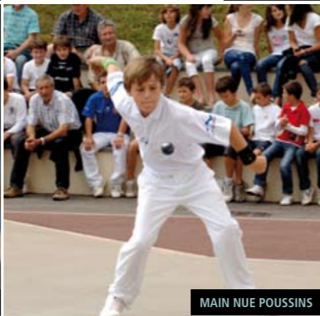
MAIN NUE POUSSINS