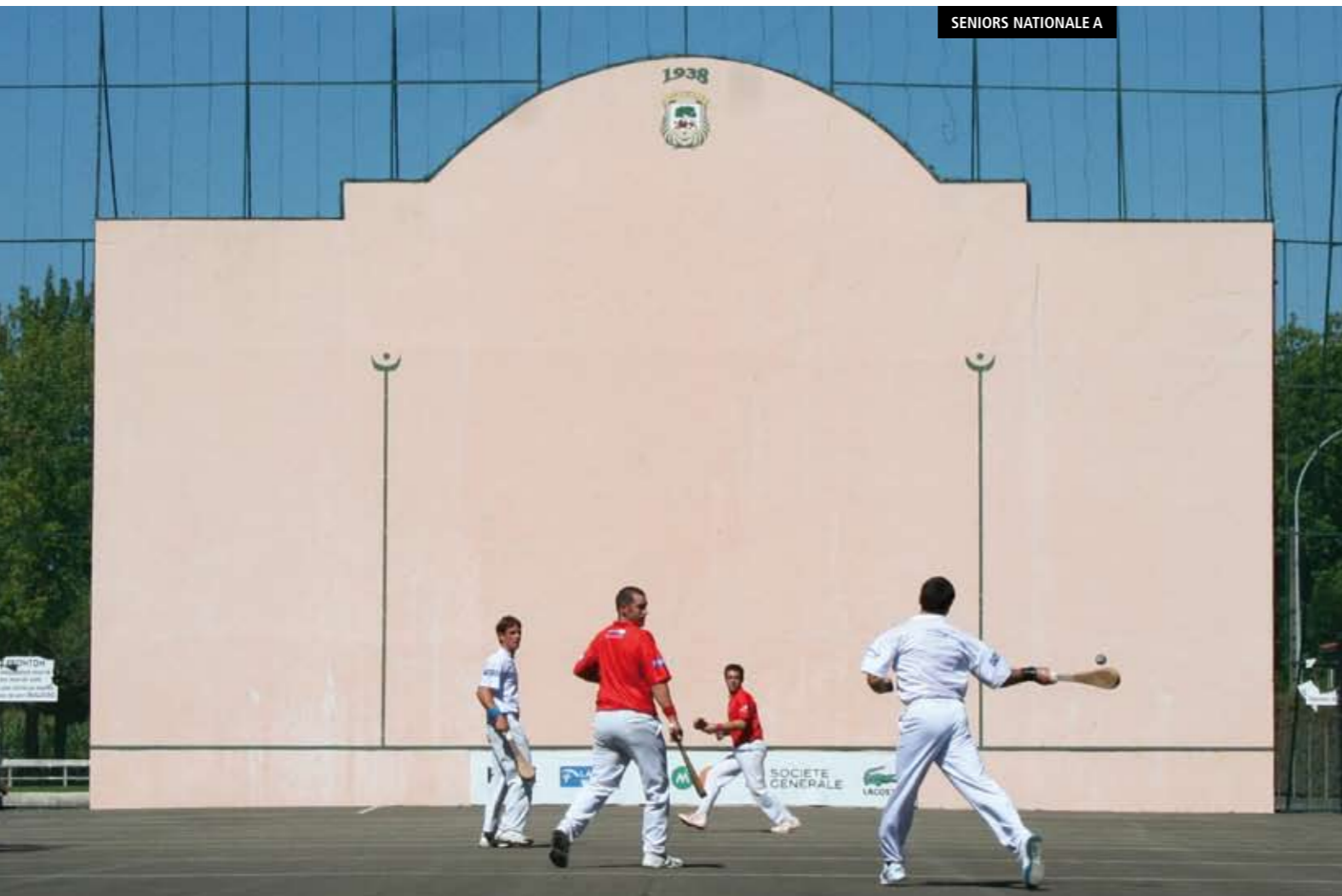
SENIORS NATIONALE A