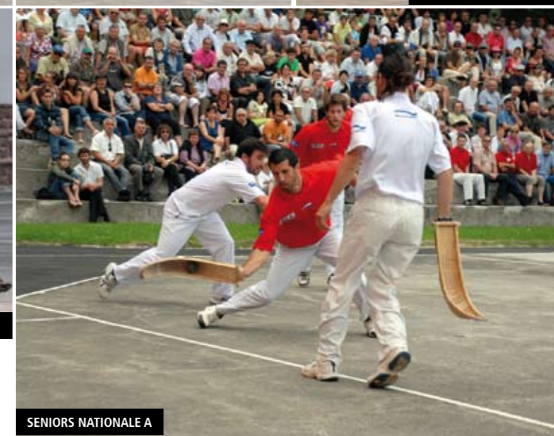
SENIORS NATIONALE A