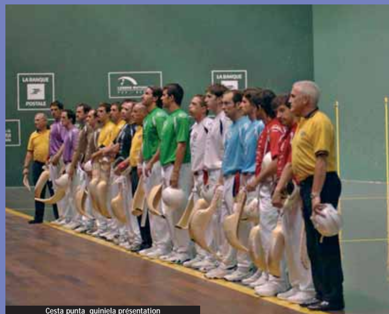
Cesta punta quiniela présentation